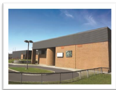
CENTRE ADMINISTRATIF CENTRE COMMUNAUTAIRE DES CHUTES 4551, boul. Sainte-Anne Québec, Qc G1C 2H8