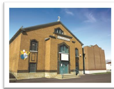
CENTRE DE LOISIRS ULRIC-TURCOTTE 35, rue Vachon Québec, Qc G1C 2V3